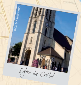
Église de Créteil

+ DE RANDO SUR www.tourisme-valdemarne.com