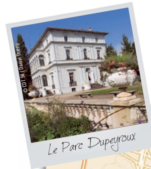
Le Parc Dupeyroux