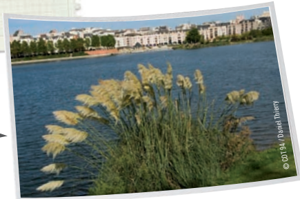
Lac de Créteil