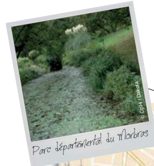
Parc départemental du Morbras