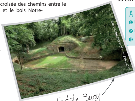
Fort de Sucey