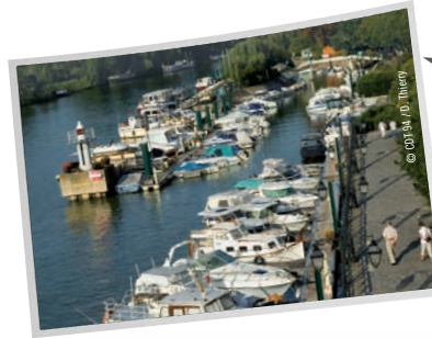
Port de Nogent-sur-Marne