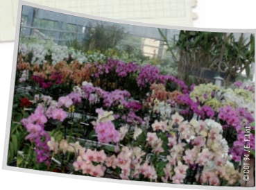
Orchidées Vacherot & Lecoufle

Ces plantes étaient, à l'origine, rapportées d'Amérique du Sud et d'Asie du Sud-Est par des explorateurs. Depuis 1886, quatre générations d'horticulteurs passionnés ont développé la culture des orchidées et acquis au fil du temps une renommée internationale.